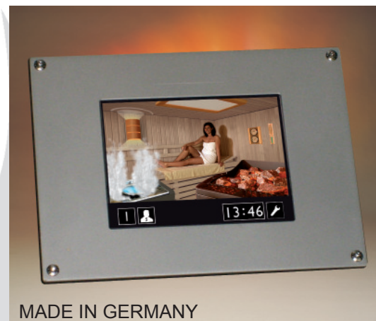
MADE IN GERMANY